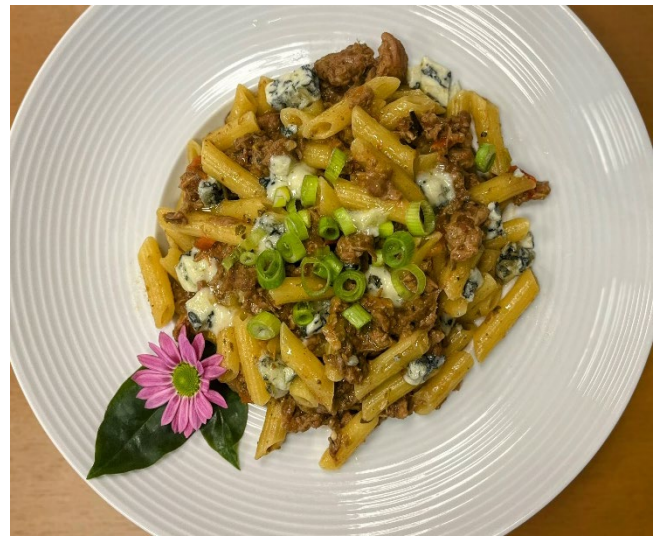
Penne com carne de panela R$ 49

Fettuccine aos quatro queijos acompanhada de escalopes de filé mignon. Serve 2 pessoas