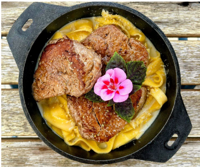
Fettuccine aos quatro queijos R$ 135

Fettuccine aos quatro queijos acompanhada de escalopes de filé mignon. Serve 2 pessoas