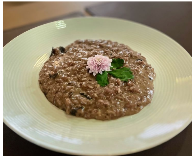
Risoto ao funghi R$ 42

Risoto de pera, gorgonzola e nozes. Acompanha escalopes de filé mignon. Serve 2 pessoas