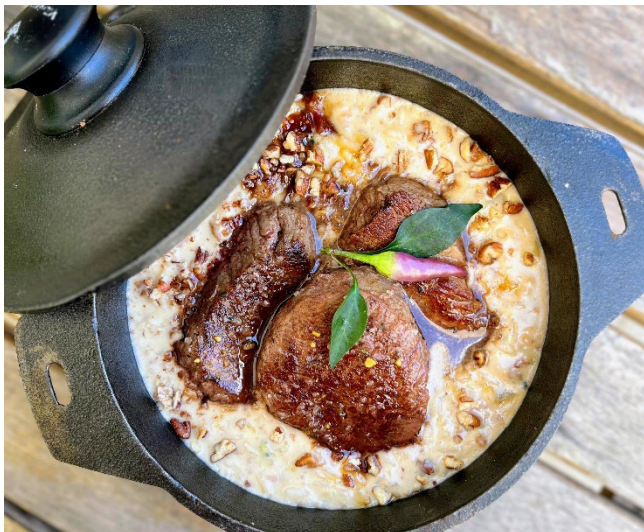
Risoto de pera, gorgonzola e nozes R$ 145

Penne com carne de panela e gorgonzola. Serve uma pessoa.