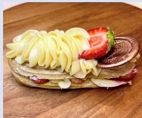
Bomba de Morango