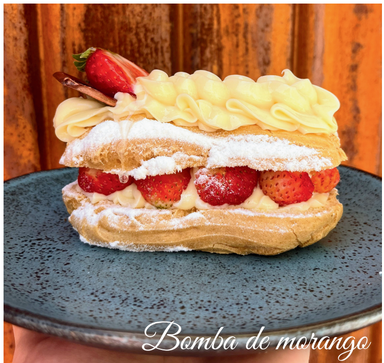
Bomba de morango