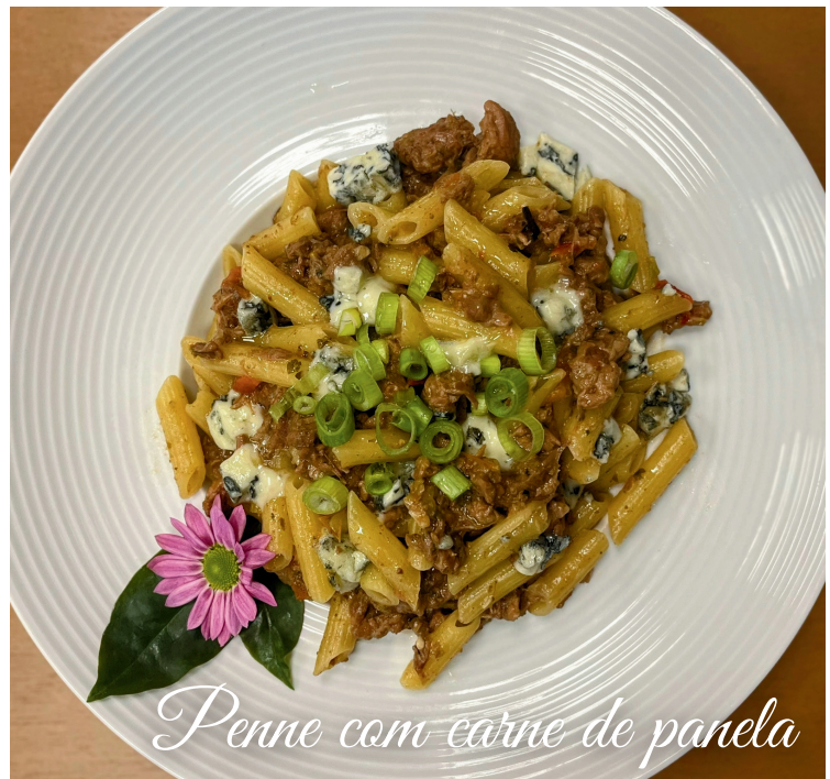
Penne com carne de panela