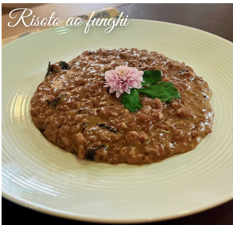
Risoto ao funghi