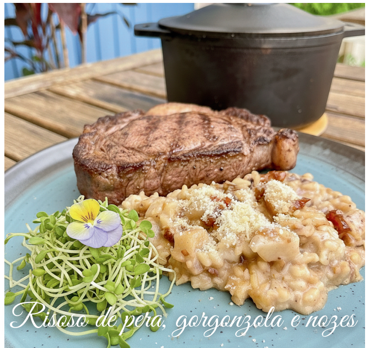
Risoto de pera, gorgonzola e nozes