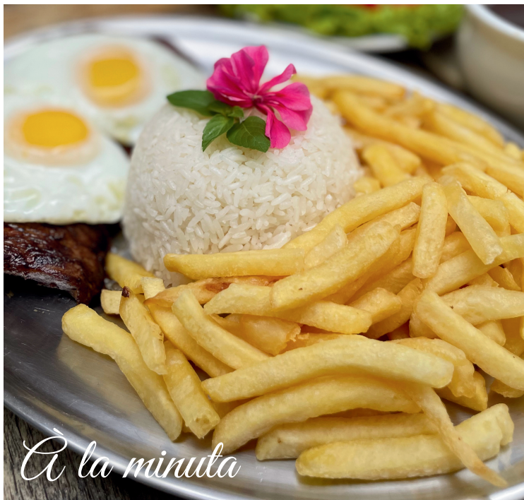
À la minuta